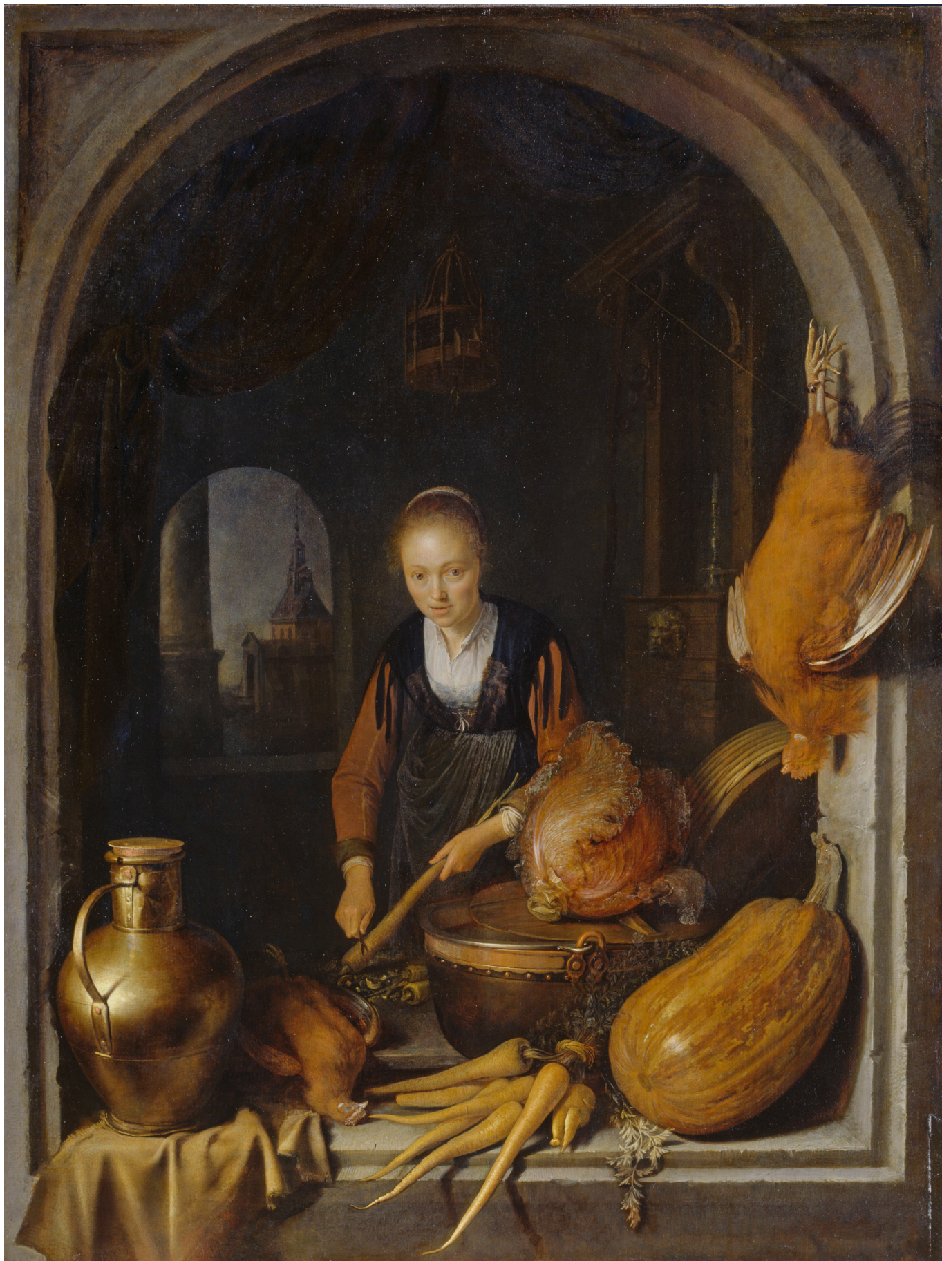
Gerard Dou, Die Möhrenputzerin, um 1650, Öl auf Holz